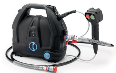
B70M-P36 便携式 液压电动泵